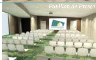
Pavillon de Presse