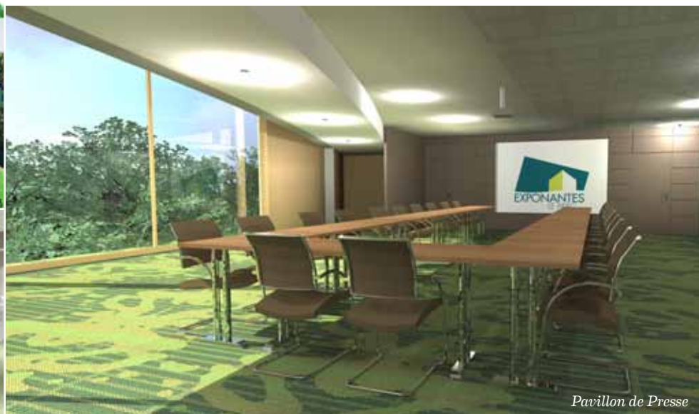
Pavillon de Presse