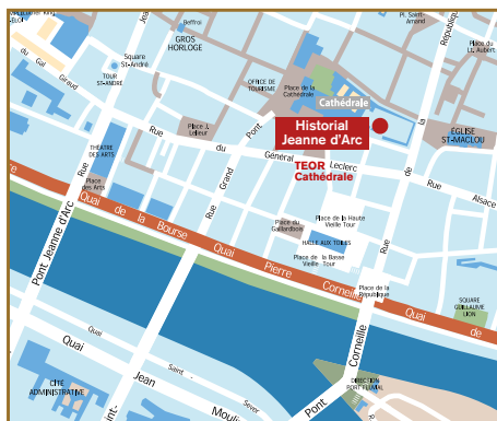
PLAN D'ACCÈS : Historial Jeanne d'Arc