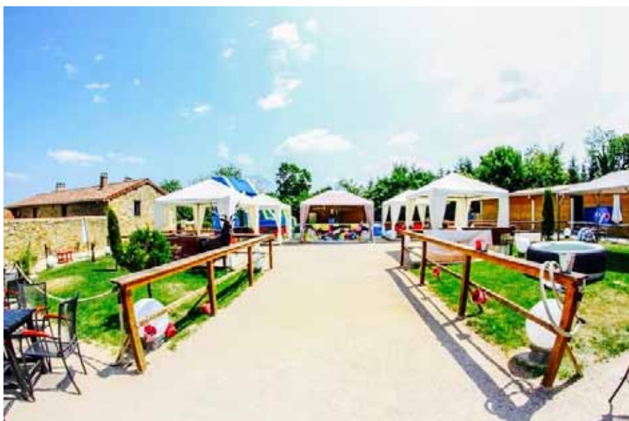
Terrasse & Jardin