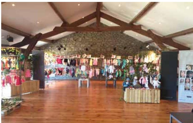
Salle Élégance, version Showroom

Mise à disposition de la Salle et du matériel (vidéoprojecteur, écran, paperboard, sonorisation, accès wifi)