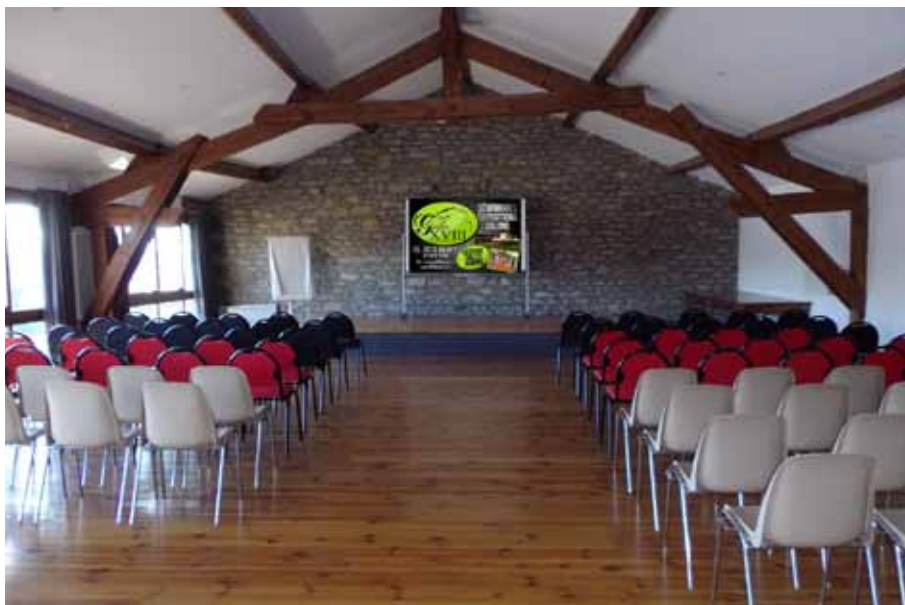
Salle Élégance, version conférence