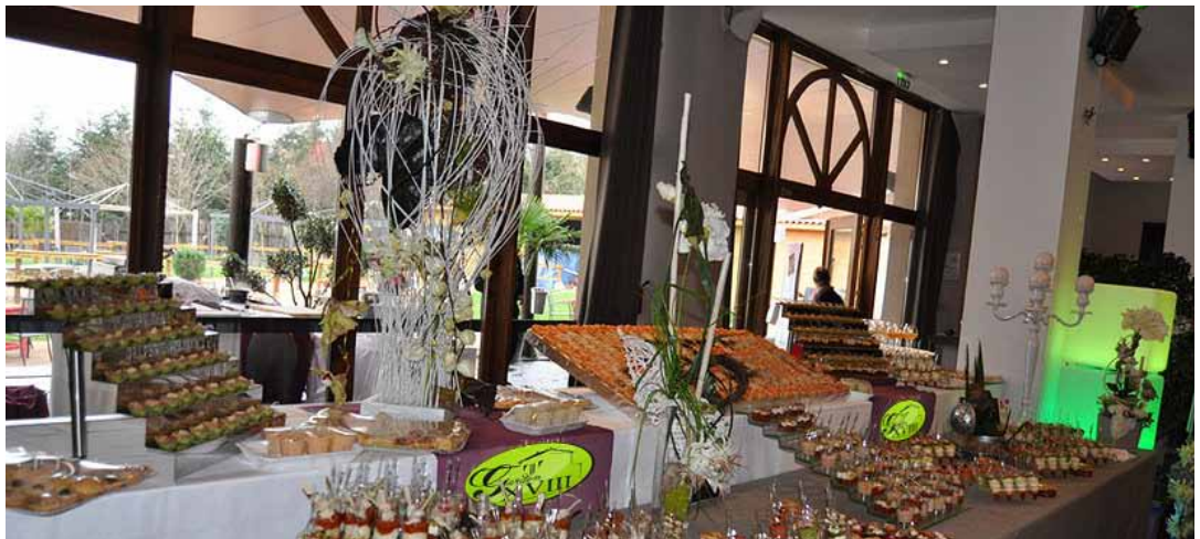
Petite salle, Club 1810, de jour

Tarte aux pommes & Macarons & 1 bouchée sucrée