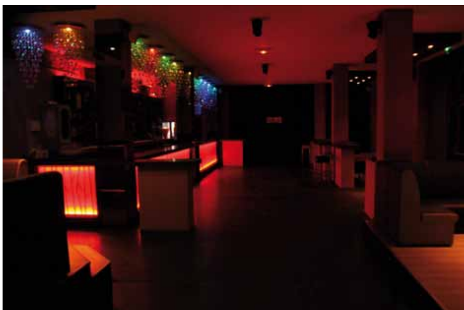
Petite salle, Club 1810, de nuit